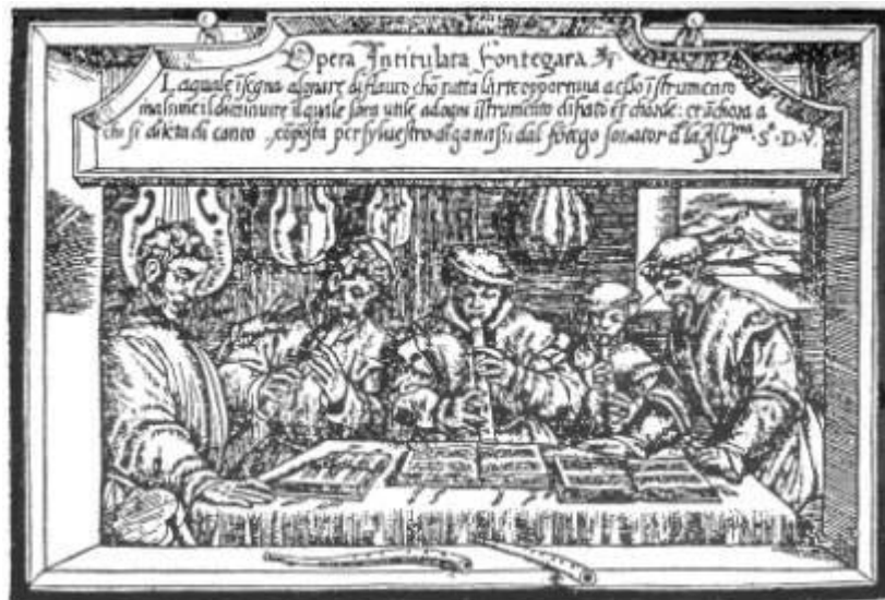
1. Frontespizio della Fontegara .