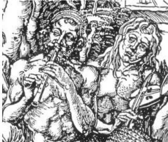
3. Albrecht Dürer, Suonatori di flauto e ribeca , xilografia, Venezia, Museo Correr (particolare).