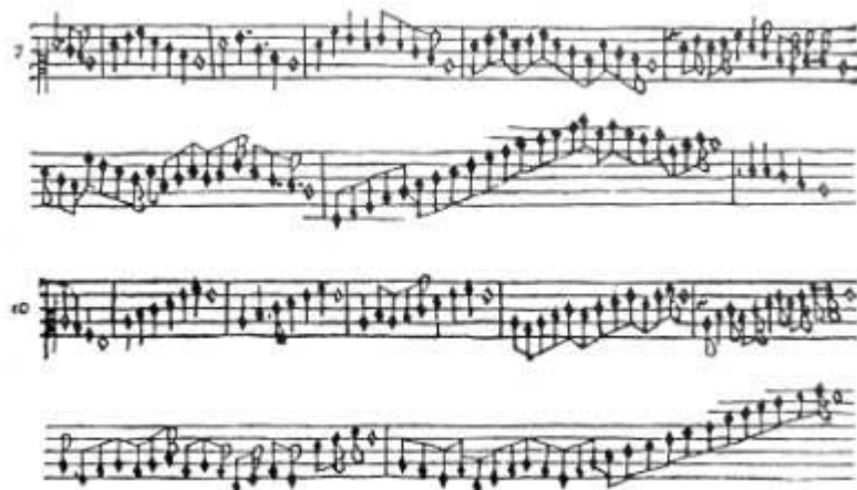
2. Esempi di diminuzioni nella Fontegara («Regola Terza, Moto de quarta dessendente»). Il n. 10 è eseguibile su uno strumento in sol', mentre il n. 7 ne richiede uno in fa'.